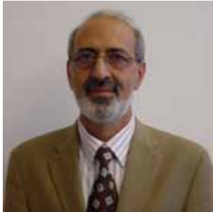
13 Sandayuk, Ilhan Dammstr. 1 56564 Neuwied