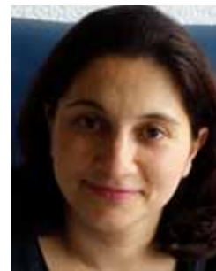
2 Akar, Pembe